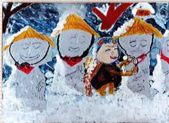
岡田小2年 池下 欧輔