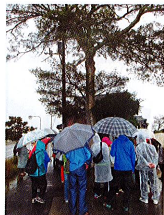
旧綾歌町の町木、モチノキです。