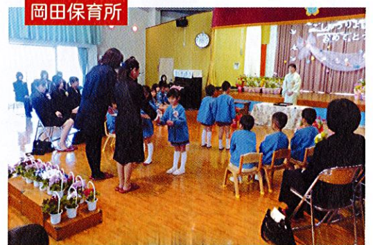
岡田保育所修了式