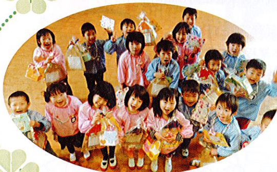
3/6(金) 岡田保育所 お別れ会