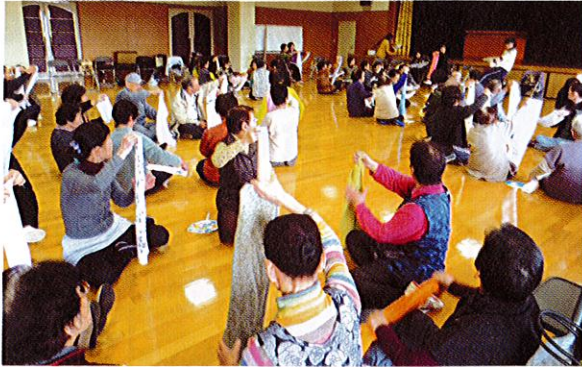
2/26(木) 長生部 楽しく体を動かす健康教室

2月26日(木)、本年度最後の行事として健康教室を開催。参加者は予定人数を上回る90人でタオルやうちわを使い遊び心、音楽などを組み合わせたやさしい体操で、寒さで凝り固まった身体をほぐしました。和気あいあい、笑顔いっぱいひと時を過ごしました。また丸亀警察署より具体的な交通事故防止策のお話があり、みんなで交通ルール厳守を誓いました。健康は何物にも代えがたい究極の財産、これからも大切に守っていききたいもの……。