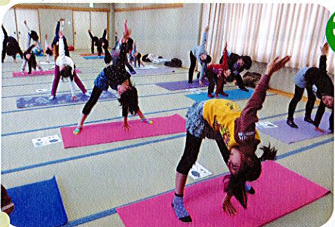
3/7(土) 体育部 親子ヨガ教室