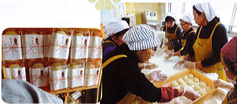
3/17(火) 福祉部 紅白もちつき 岡田小卒業生、岡田保育所 卒業記念お祝い餅つき