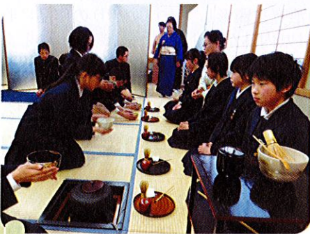
2/26(木) 岡田小学校 卒業お茶会