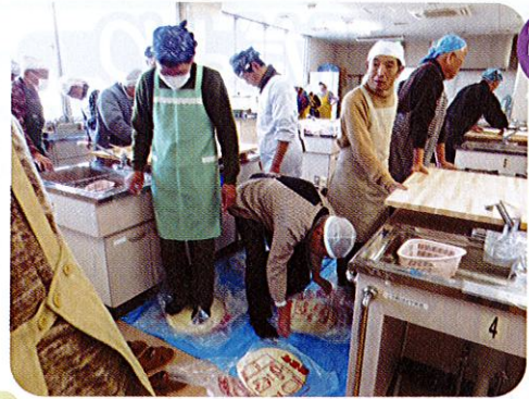
2/21(土) 福祉部 男性の料理教室

2月26日(木)、本年度最後の行事として健康教室を開催。参加者は予定人数を上回る90人でタオルやうちわを使い遊び心、音楽などを組み合わせたやさしい体操で、寒さで凝り固まった身体をほぐしました。和気あいあい、笑顔いっぱいひと時を過ごしました。また丸亀警察署より具体的な交通事故防止策のお話があり、みんなで交通ルール厳守を誓いました。健康は何物にも代えがたい究極の財産、これからも大切に守っていききたいもの……。