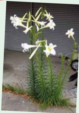
タカサゴユリも！ (投稿者 花野さん)

いつの間にか、コンクリートのつなぎ目にタカサゴユリがずらり7本。こんなにたくさんの花が咲き、目を楽しませてくれました。しかし、これは、繁殖力が強い外来種とのこと。今後どうしようかな。