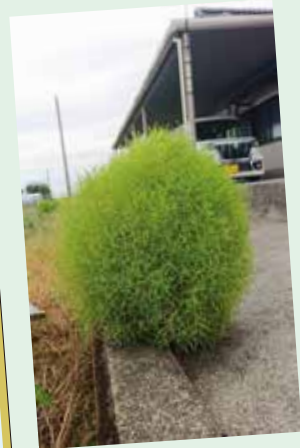
ど根性コキア

気が付くとコンクリートの隙間からコキアが！秋の紅葉まで無事に育つように毎日の水やりが日課になりました。