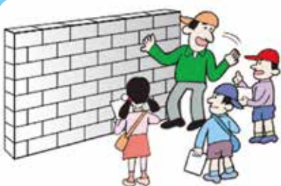
身のまわりの危険な場所を教えあいましょう

地震のゆれは、地面のかたさ・やわらかさによって変わります。地面のやわらかいところでは、小さな地震でも大きくゆれます。地面のゆれやすさを示した地図が「ゆれやすさマップ」です。